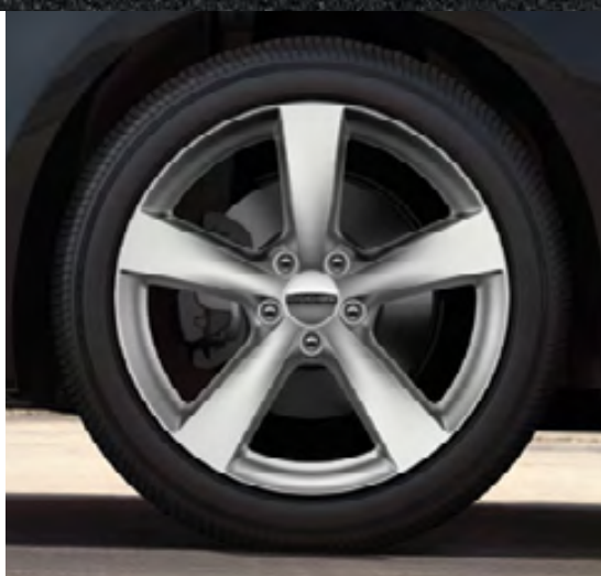
Aluminio de 18 pulgadas en plateado satinado (estándar en la versión GT)