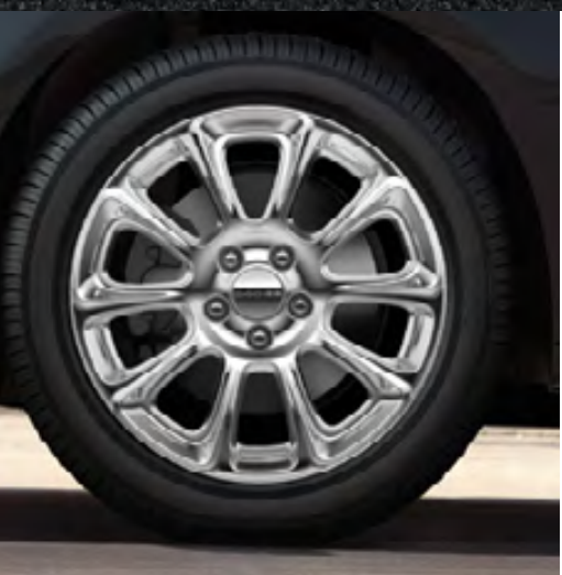
Aluminio pulido de 17 pulgadas (opcional en la versión Limited)