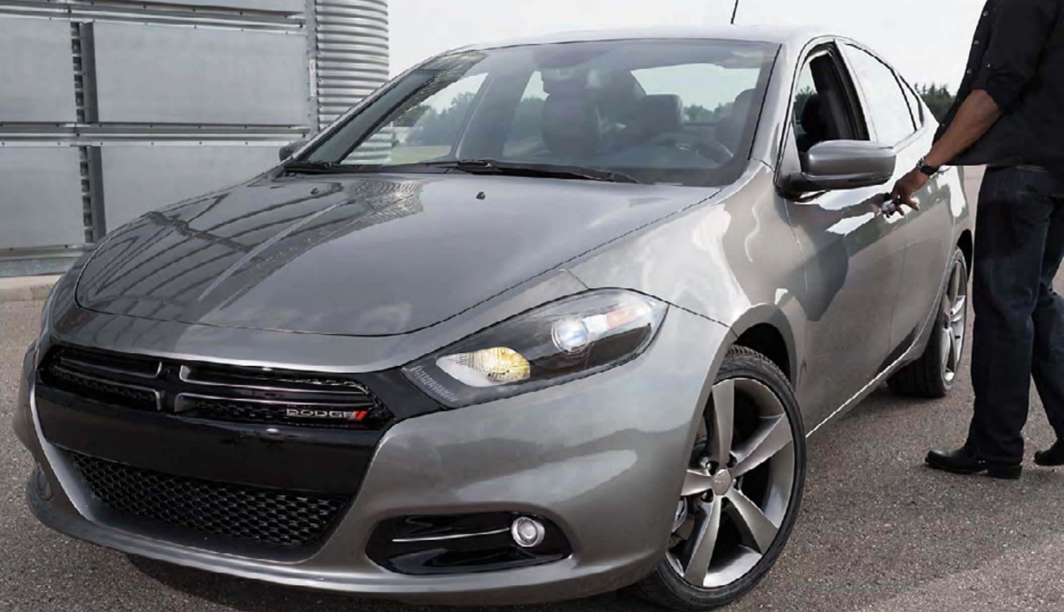
Dart GT en granito cristal metálico.