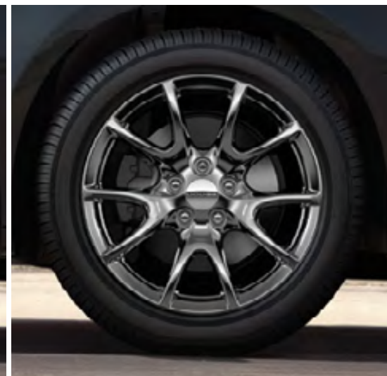
Aluminio de 17 pulgadas en negro Hyper (incluidas en el Grupo de apariencia Rallye en el SXT)