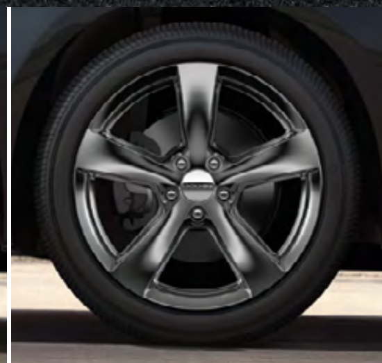
Aluminio de 18 pulgadas en negro Hyper (opcional en la versión GT)