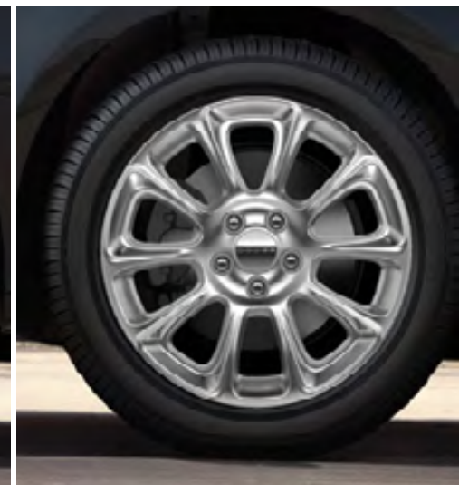
Aluminio de 17 pulgadas en plateado satinado (estándar en Limited)