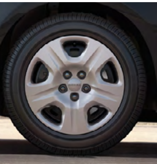
Tapa de rueda de 16 pulgadas (estándar en la versión SE)