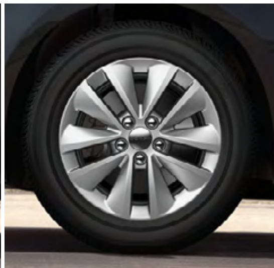
Aluminio de 16 pulgadas en plateado Tech (estándar en las versiones SXT y Aero)