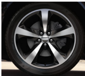
Ruedas de aluminio pulido de 20 pulgadas con bolsillos en negro brillante (estándares en R/T Classic)