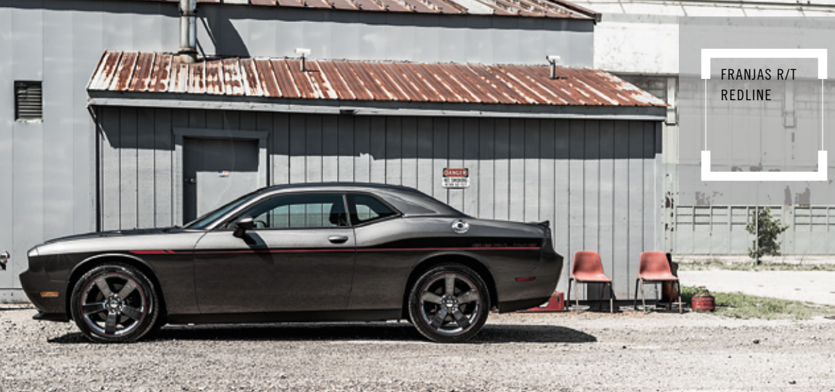
FRANJAS R/T REDLINE