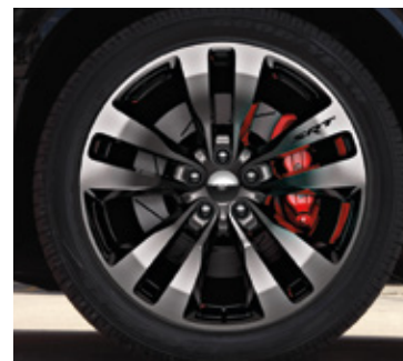
Ruedas de aluminio de 20 pulgadas en negro vapor brillante (opcionales en SRT Core y SRT 392)