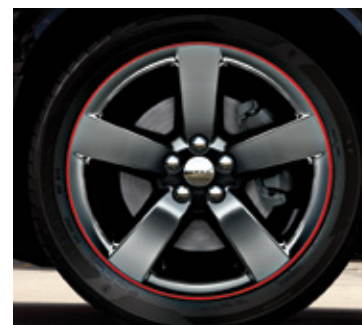
Ruedas de aluminio en negro brillante de 20 pulgadas con eje central y borde rojos (estándares en Rallye Redline e incluidas en el grupo R/T Redline para R/T y R/T Plus)