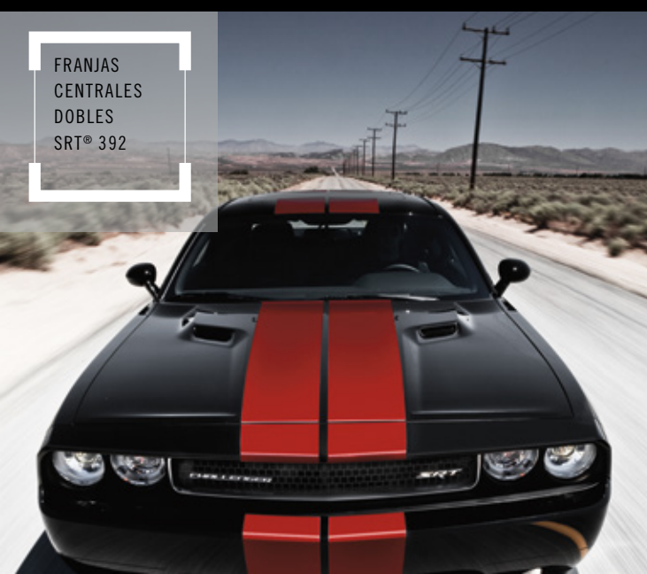
FRANJAS CENTRALES DOBLES SRT® 392