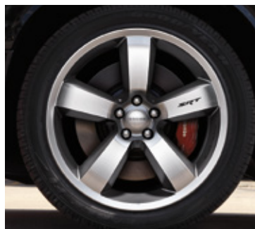
Ruedas de aluminio forjado y pulido de 20 pulgadas con bolsillos en negro (estándares en SRT 392)