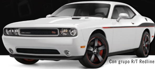
Con grupo R/T Redline