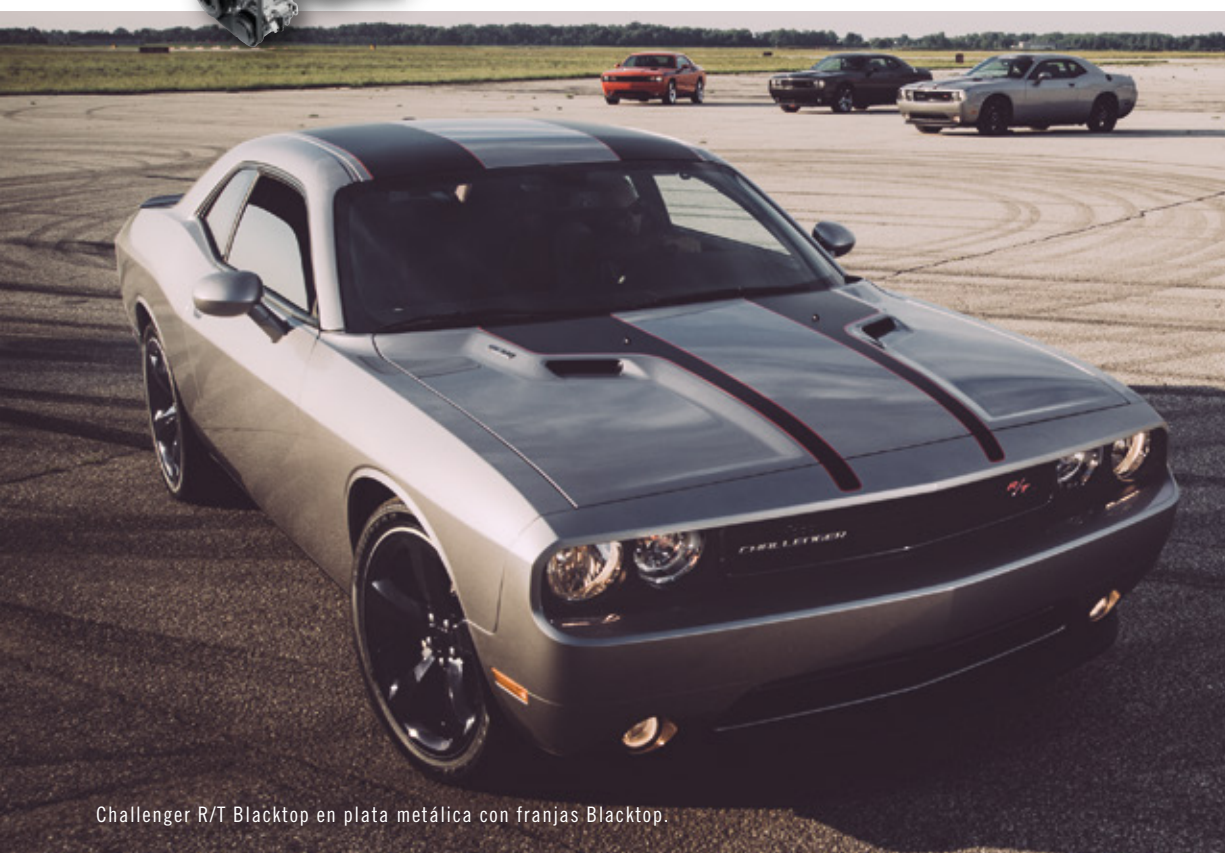
Challenger R/T Blacktop en plata metálica con franjas Blacktop.

MOTOR HEMI V8 SRT® DE 392 PULGADAS CÚBICAS CON 470 LB-PIE DE TORSIÓN