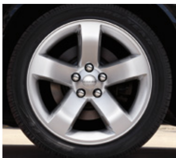
Ruedas de aluminio de 18 pulgadas (estándares en SXT, SXT Plus, R/T y R/T Plus)