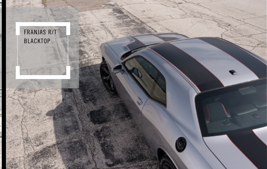
FRANJAS R/T BLACKTOP