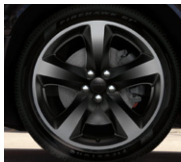
Ruedas de aluminio en negro brillante de 20 pulgadas (incluidas en el grupo super deportivo Sinister para SXT y SXT Plus, y en el paquete Blacktop para R/T y R/T Plus)