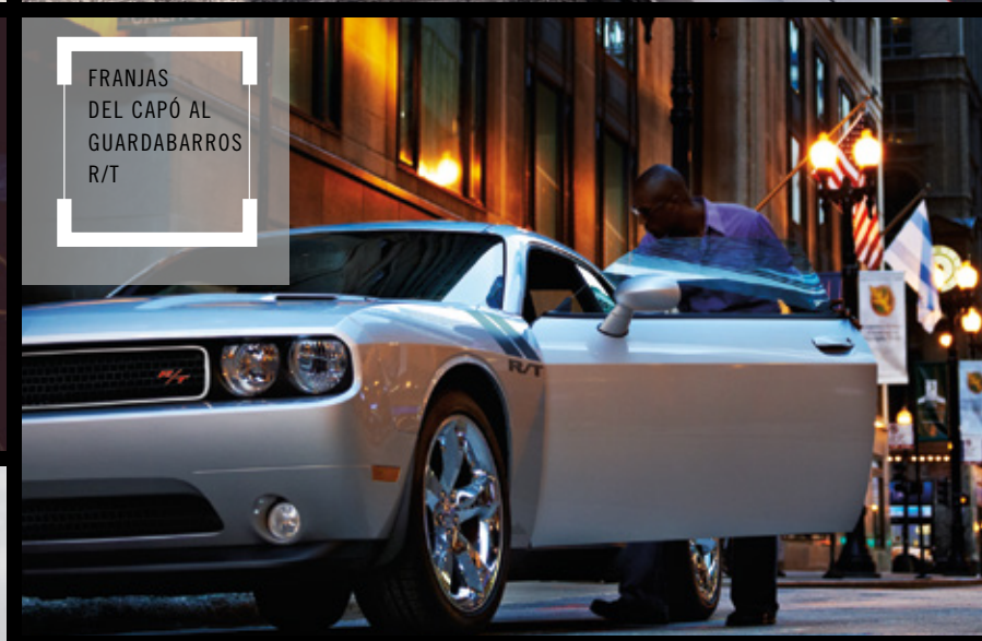
FRANJAS DEL CAPÓ AL GUARDABARROS R/T