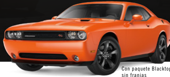
Con paquete Blacktop sin franjas