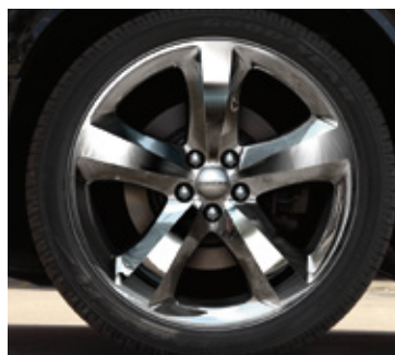
Ruedas de aluminio cromado de 20 pulgadas (incluidas en el grupo super deportivo para SXT y SXT Plus, y opcionales en R/T y R/T Plus)