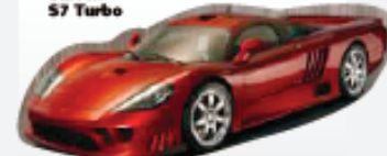
Saleen S7 Turbo

«американца» – Saleen S7 с двумя турбинами. Пленка его возможностей – на уровне 399 км/ч, а 60 миль/ч с места он делает за 2,8 с. Отличный результат с учетом того, что двигатель у него самый скромный среди перечисленных «спорсменов» – 750-сильный V8, зато Saleen S7 дешевле Veyron Super Sport более чем в четыре раза!